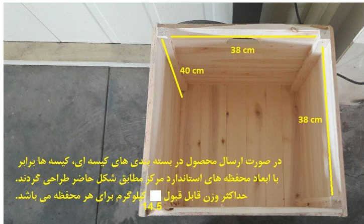
شکل ۳: ابعاد پالت چوبی پرتودهی