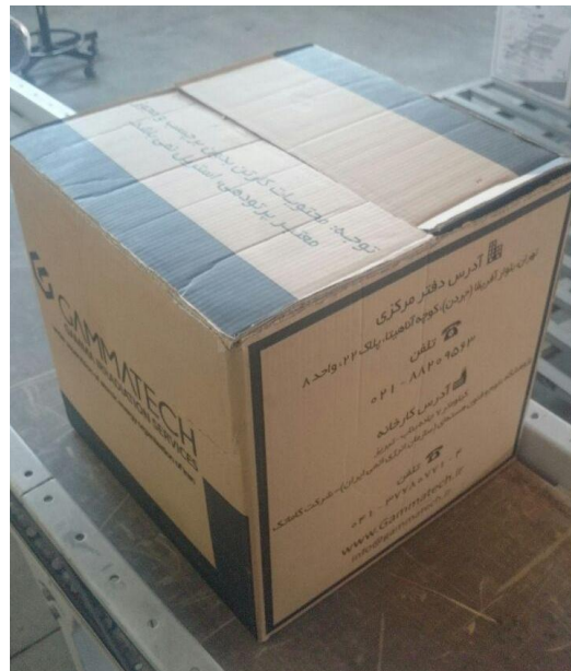
شکل ۲: کارتن پرتودهی

✓ حداقل وزن قابل قبول کارتن‌ها ۶ کیلوگرم و حداکثر وزن آنها ۲۰ کیلوگرم است.