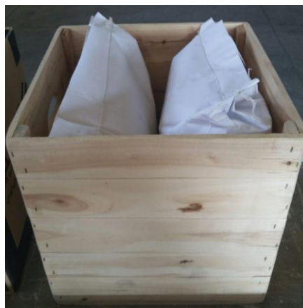
شکل ۴: پالت چوبی پرتودهی پر شده